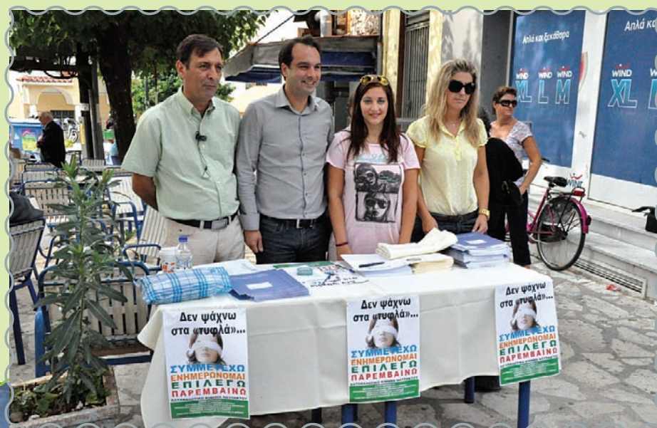
Εργατικό Κέντρο Ναυπάκτου

Και επειδή ο Σεπτέμβριος είναι ένας δύσκολος μήνας για τους εργαζόμενους, αλλά κυρίως για τους ανέργους, καθώς ξεκίνησε η νέα σχολική χρονιά που απαιτεί πολλά έξοδα, θα γίνει και μια προσπάθεια προβολής όλων των επιχειρήσεων που θέλουν να γίνουν μέλη της «σχολικής συμμαχίας» κατά της ακρίβειας.